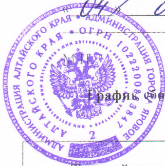
График сбора и транспортирования твердых коммунальных отходов г.Ярвое с 01 сентября 2023 года